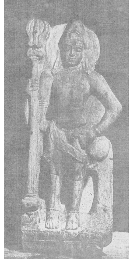
படம்: சிவனைப் போன்ற தோற்றமுடைய முருகன் - ஆந்திர மாநிலம் சேஜர்லா)